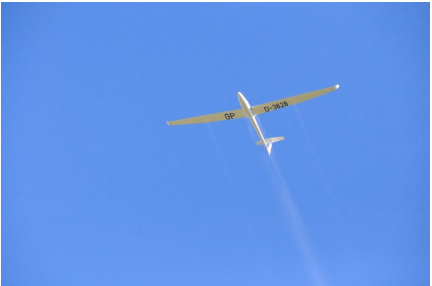
_ Die LS 8 mit Pilot Gerd Peter Lauer beim Ablassen des Wasserballastes vor der Landung

Das bisher heißeste Wochenende der diesjährigen Ligarunden werden die Segelflieger des Aero Club Lichtenfels so schnell nicht vergessen. Die Temperaturen an die 40°C waren beim Vorbereiten der Flugzeuge kaum zu ertragen, und die Piloten hätten das enge Cockpit lieber mit dem kühlen Nass in einem Pool vertauscht. Die Vorhersage im Segelflugwetterbericht meldete bei den tropischen Temperaturen auch nur mäßige Blauthermik und wenn überhaupt ein paar wenige Wolken im mehr als 100 km entfernten Erzgebirge. Um keine wertvollen Punkte in der Liga zu verschenken ging das Lichtenfelser Dreierteam am Nachmittag bei Einsetzen der Blauthermik schweißgebadet an den Start und machte sich auf den zunächst recht mühsamen Weg Richtung Erzgebirge. Ab Hof gab es dann die ersehnten ersten Cumulus Wolken mit Hammerthermik bis auf dreitausend Meter. Die Geduld hatte sich gelohnt und man konnte sich in diesen Höhen bei angenehmen Temperaturen abkühlen und den Flug über die herrliche Landschaft genießen.